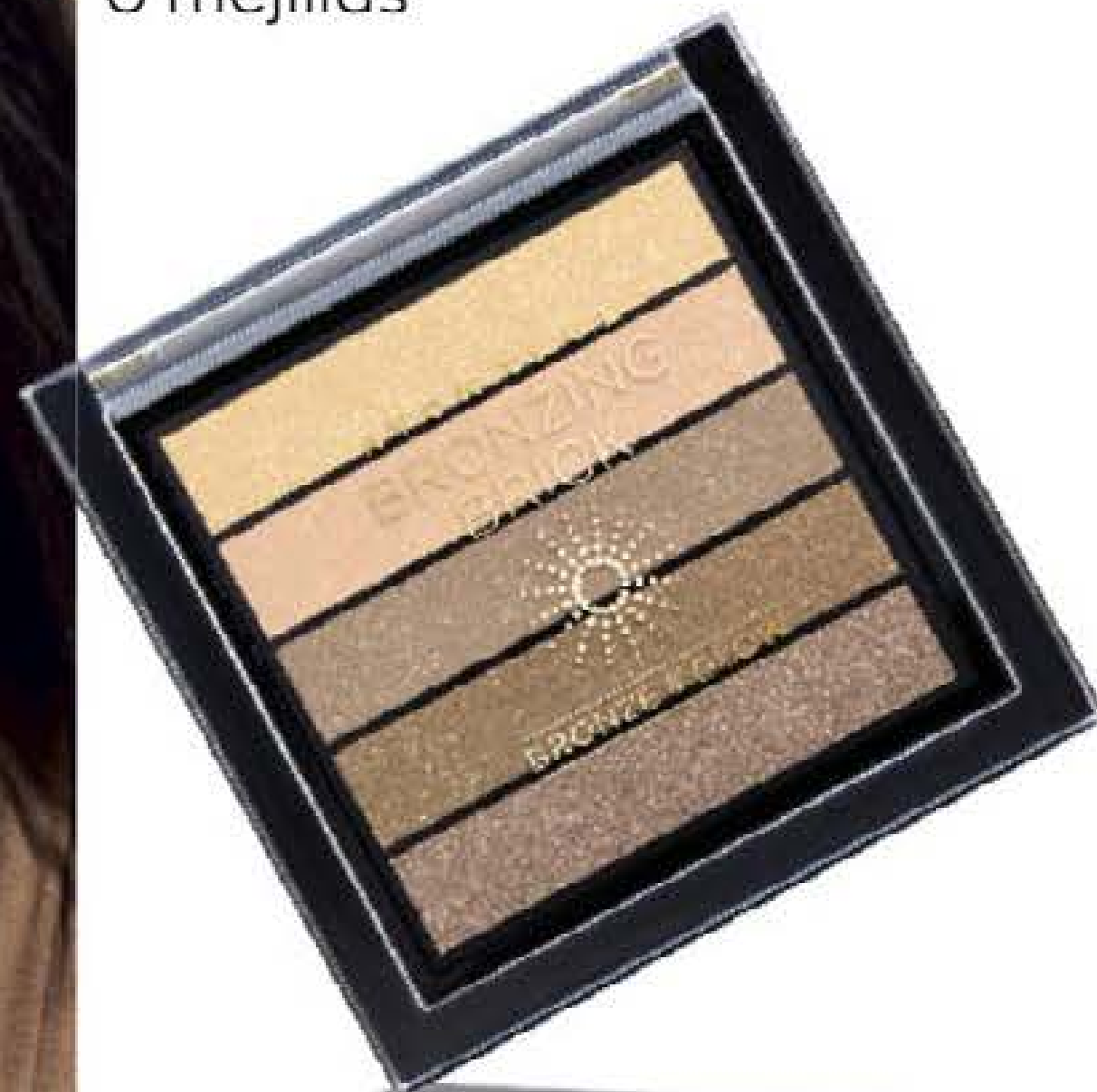
Paleta Bronceadora Avon True Bronze & Glow 2,8 g

brillo multi-dimensional para iluminar ojos o mejillas